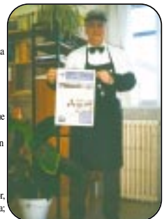
Presentación "oficial" del primer ejemplar del periódico colegial por parte de su Coordinador-Director, caracterizado al efecto (tipógrafo-litopista antiguo)

Por último, me gustaría animar a la gente a que participe en las actividades del colegio y a escribir en el siguiente número del periódico, así como en los juegos y concursos que éste contiene.